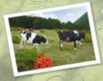
つつじの間を這いかけっこ。ゆったり過ごす牛に癒されて♪