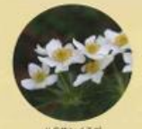
ハクサンイナゴ 6月