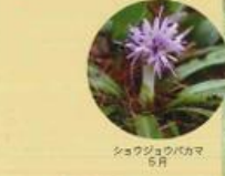
ショクゾウのバカマ 5月