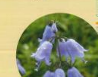
ツツガニクソウ 8月