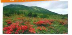
つつじ平のレンゲツツジ大群落は、国の天然記念物にも指定され、初夏6月下旬には湯の丸山の山肌を鮮やかな朱色の絨毯のように染め上げます。