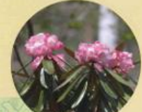
アズマシクナガ 6月