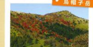
鳥帽子岳 浅間山系の最西端にそびえ、古の真人の被る鳥帽子のように尖った頂上の形から、その名が付いたといわれます。